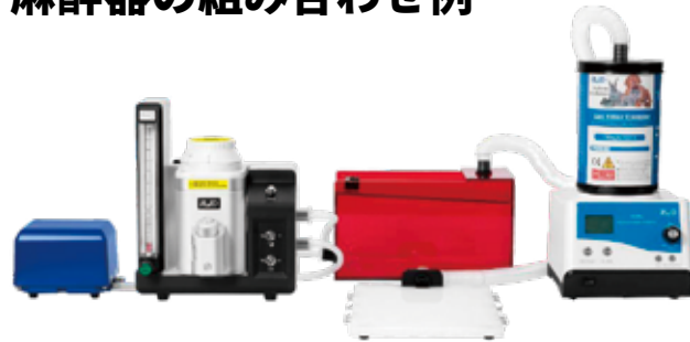
例 1. マスク・麻酔ボックスとの組み合わせ