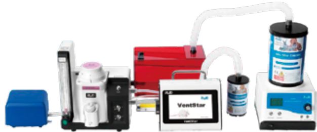
例 3. デジタル式人工呼吸器との組み合わせ